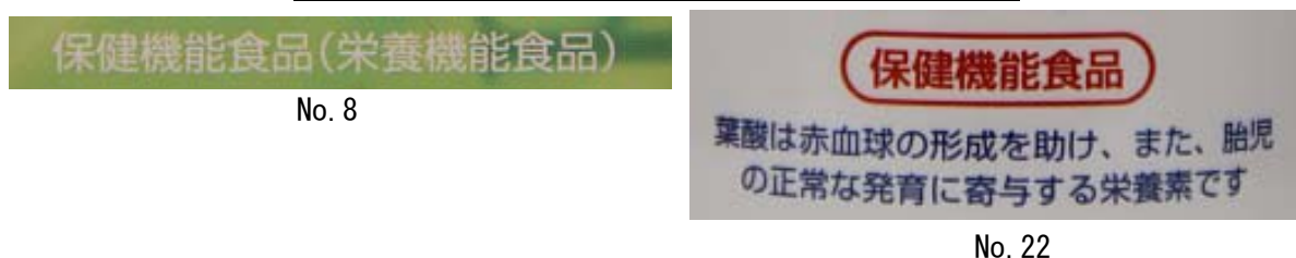
図2. No. 8 及び 22 の「栄養機能食品」に関する表示

栄養機能食品では、健康増進法により「栄養機能食品（葉酸）」のように機能表示をする栄養成分の名称を「栄養機能食品」の表示に続けて表示することとなっているが、No.8 及び 22 では、対象となる栄養成分の名称（葉酸）が表示されていなかった（図2）。